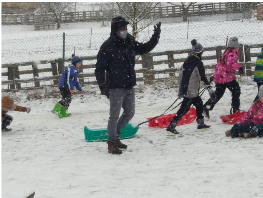
Hry na školní zahradě