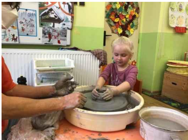
Projektový den Malý hrnčič