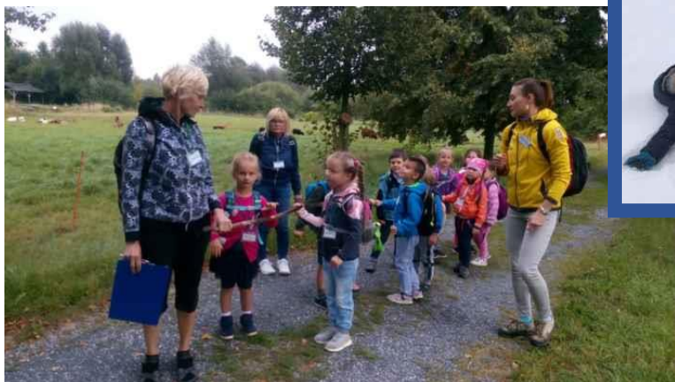
Na jedné z mnoha vycházek do okolí školy, do přírody