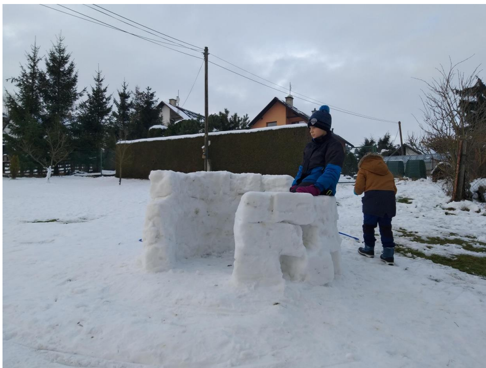
Stavíme eskymácké iglú