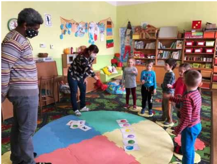
Zapojení rodičů mluvčího