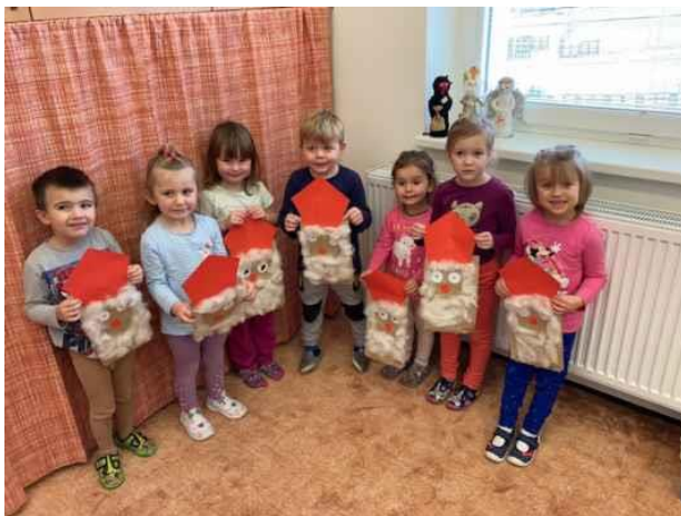
Třída krtečků a Mikuláš