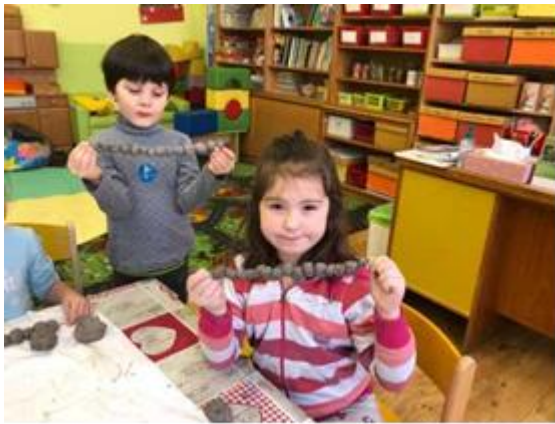
Stále tvoříme něco nového