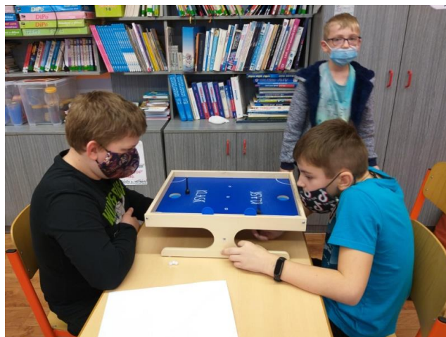
Turnaj v dánské hře Klask