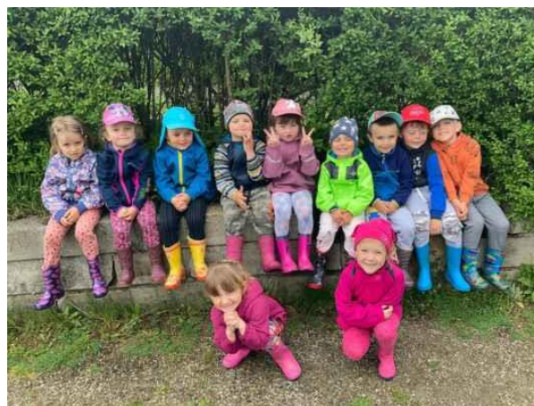
Naši malí Krtečci