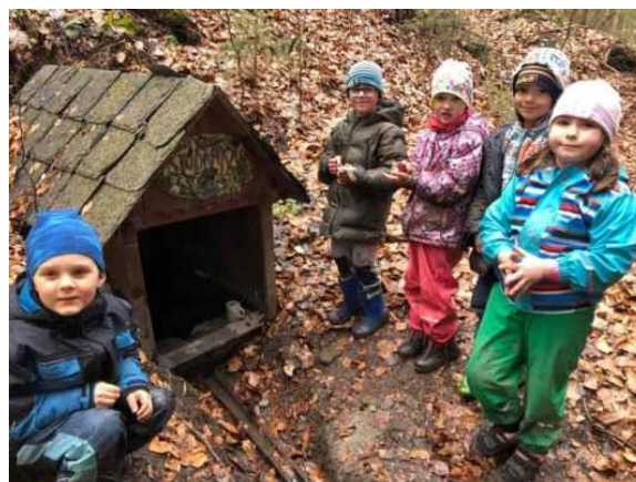
Každoroční Otvírání nebo zavírání naší studánky

Podklady pro bod ad 15) Mateřská škola zpracovala Sobotová Jarmila, učitelka MŠ