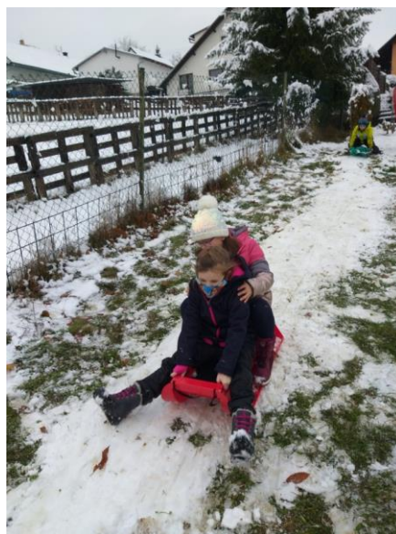
hrátky na prvním sněhu