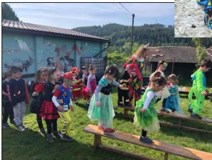
Karneval na školní zahradě