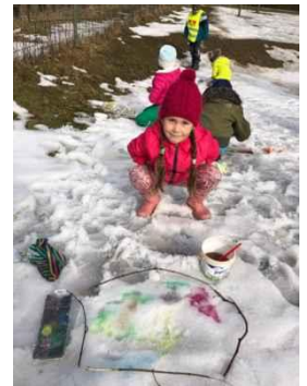
Podruhé máme titul EKOŠKOLA, obhájili jsme!