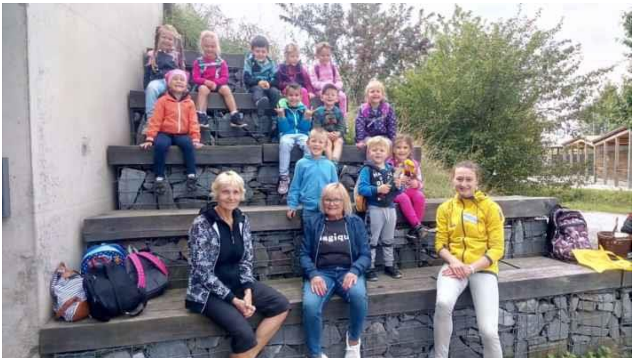
Výlet do Sluňákova s paní asistentkou a studentkou z Německa